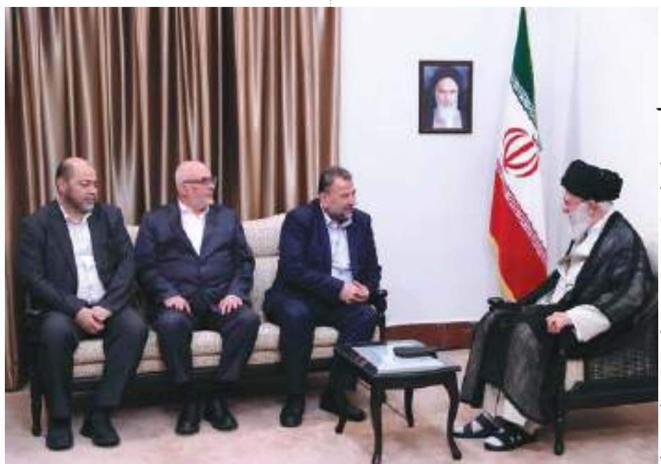
دیدار نایب رئیس دفتر سیاسی حماس با رهبر معظم انقلاب ۱۳۹۸

هزاران لبنانی روز پنجشنبه برای تشییع پیکر صالح العاروری به خیابان های بیروت آمدند و پیکر این