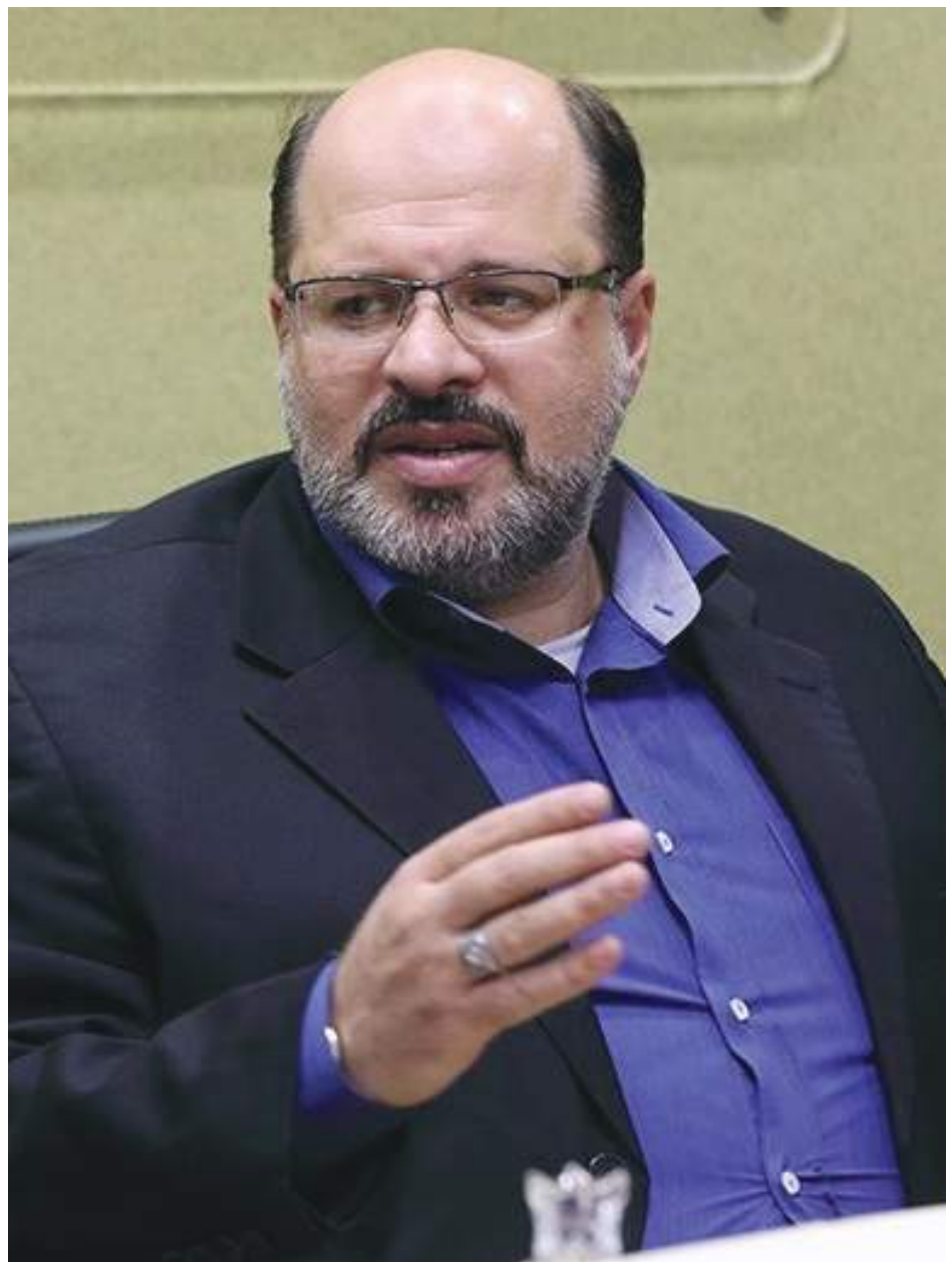
گفتاری از دکتر خالد قدومی نماینده جنبش مقاومت اسلامی فلسطین (حماس) در ایران

این یک تغییر واقعی در تفکر نظامی مجاهدان و مبارزان است که از یک قرن پیش برای مقابله با استعمار انگلیس و صهیونیست‌ها آغاز شده است. در طول این استعمار ۷۵ ساله، اولین پایه‌های مقاومت بر اساس ایده قیام مردمی و حمله به دشمن با تمام قوا بنا شد. سپس به تئوری اقتصاد قدرت تبدیل شد، یعنی می‌توانید از هر چیزی که دارید بهره بگیرید. سپس تا سرحد موازنه تحمیل ترس و موازنه بازدارندگی با دشمن پیش رفت و پس از آن به نظریه تحمیل هزینه سنگین به اشغالگران در سطوح اقتصادی و امنیتی رسید که با موفقیت و به وضوح منجر به فرار دشمن صهیونیستی در سال ۲۰۰۵ بدون هیچ محدودیت و قید و شرط و بدون هیچ توافقی شد؛ و امروز در سال ۲۰۲۳ تحت یک دکترین و تفکر جدیدی به عملیات مبارکی تحت عنوان طوفان الاقصی مبدل گشته که همان دکترین حضور