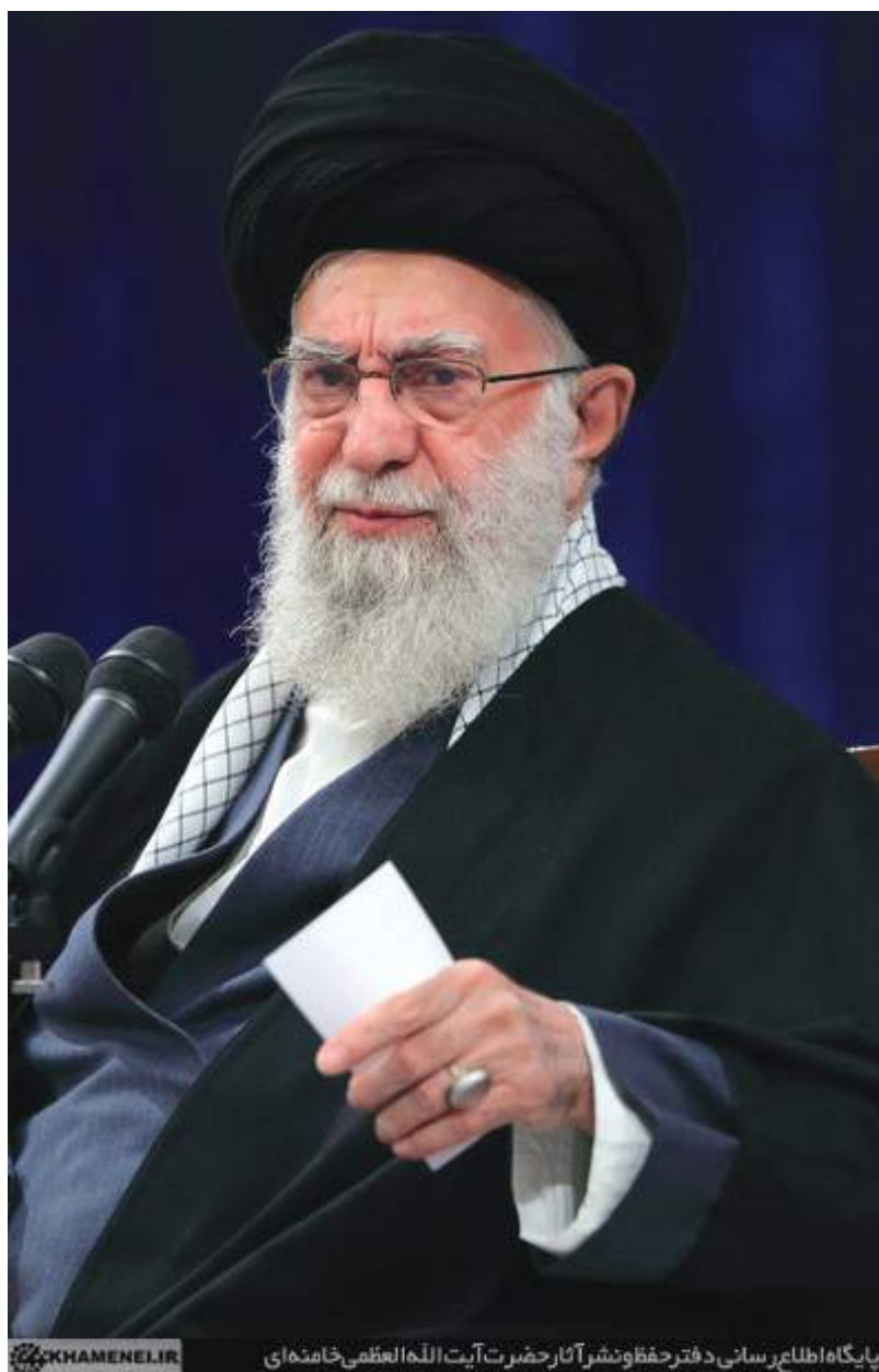
پایگاه اطلاع‌رسانی دفتر حفظ و نشر آثار حضرت آیت‌الله العظمی خامنه‌ای

نظام اسلامی برای حل مسئله‌ی فلسطین و از بین رفتن رژیم جعلی که منشأ تروریسم و ناامنی در منطقه است راه‌حلی مشخص و مردم‌سالارانه پیش روی جهانیان قرار داده است: «راه حل منطقی راه‌حلی است که همه وجدانهای بیدار دنیا و همه کسانی که به مفاهیم امروز دنیا معتقدند، ناچارند آن را قبول کنند... راه حل نظرخواهی از خود مردم فلسطین؛ همه کسانی که از فلسطین آواره شده‌اند؛ البته آنهايي که مایلند به سرزمین فلسطین و به خانه خودشان برگردند... و از کسانی که قبل از سال ۱۹۴۸ که سال تشکیل دولت جعلی اسرائیل است، در فلسطین بوده‌اند -چه مسلمان شان، چه مسیحی شان، چه یهودی شان- نظرخواهی شود. اینها در یک نظرخواهی عمومی، رژیم حاکم بر سرزمین فلسطین را تعیین کنند. این دموکراسی است... آن رژیم و آن دولت، تشکیل شود و درباره کسانی که