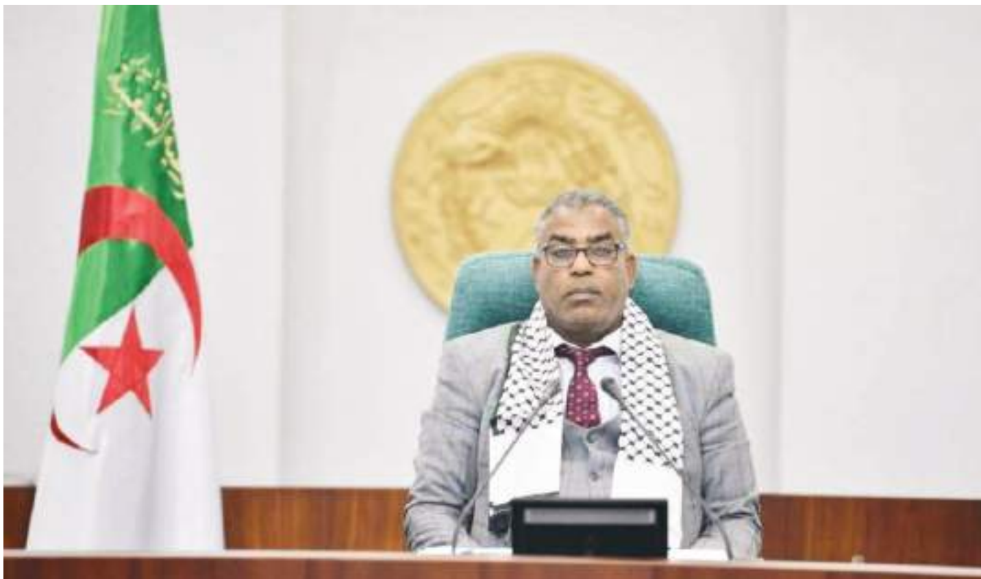
گفت و شنود شاهد یاران با «موسی خرفی»، نایب رئیس مجلس ملی الجزایر