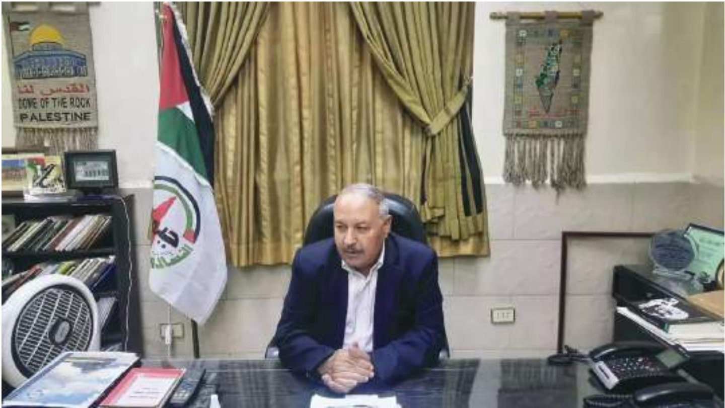
صهیونیستی آگاه هستند

پیامدهای این جنگ و این عملیات در پیروزی مقاومت فلسطین با حمایت و پشتیبانی مردم شریف در محور مقاومت و در خط مقدم آن نقش محوری جمهوری اسلامی ایران است. شکست رژیم صهیونیستی یک شکست برای ایالات متحده آمریکا است، بنابراین شاهد این نقش و تهاجم آمریکا به نیروهای مقاومت در منطقه هستیم